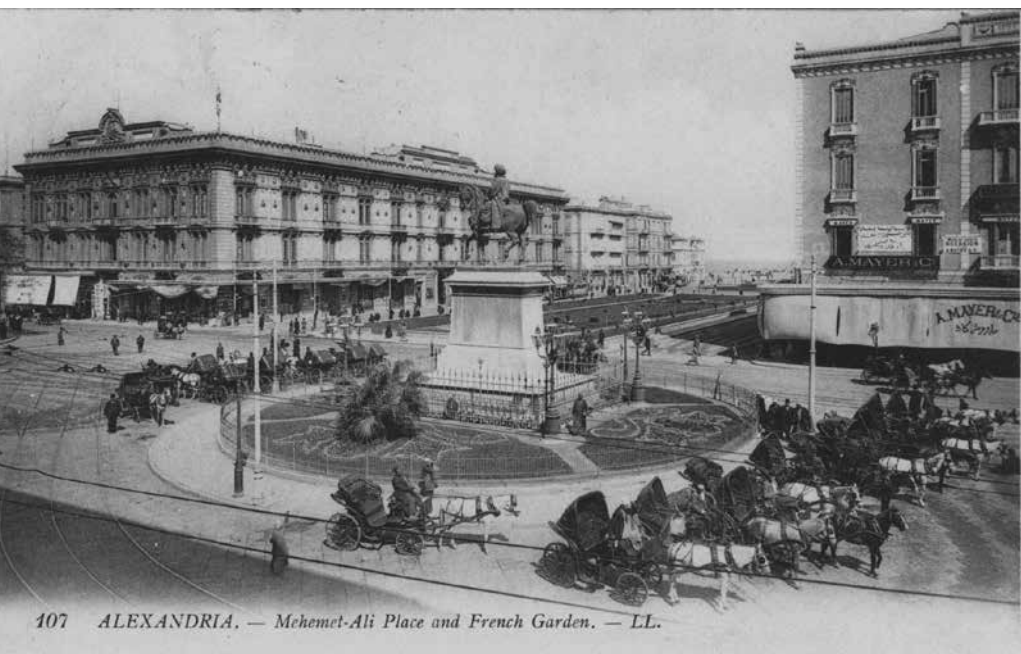
107 ALEXANDRIA. — Mehmet-Ali Place and French Garden. — LL.

nekdo te je moral odkriti obrusiti v briljant da si stopala ob njem on tvoj vodnik ti njegova srečna zvezda okovana v zlatu