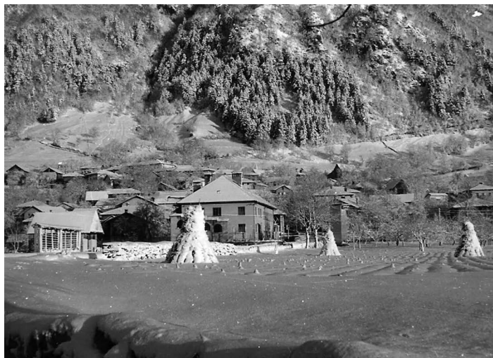
Zatočmin okrog leta 1960.