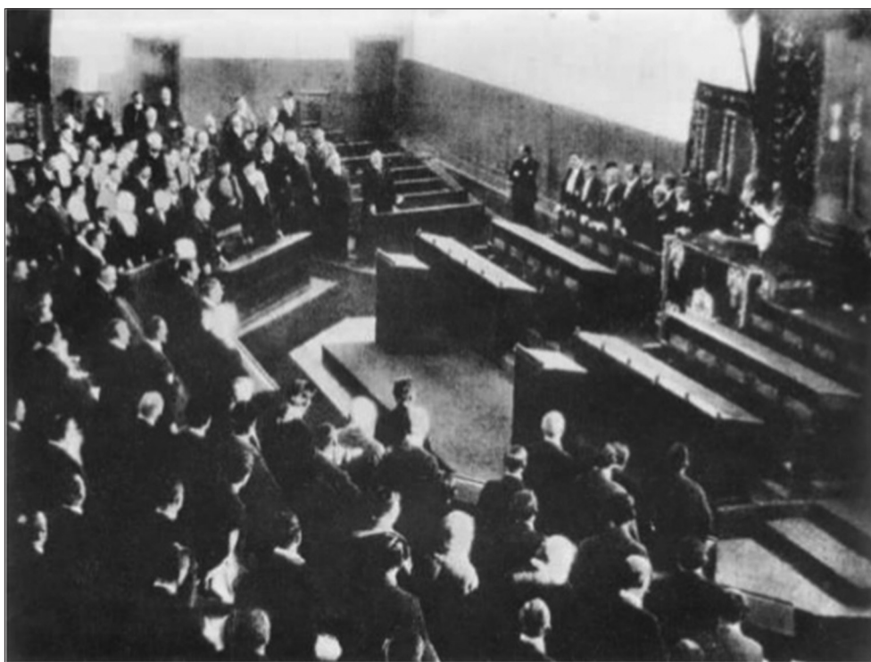
Slika 46: Razglasitev ustave Kraljevine Srbov, Hrvatov in Slovencev v Ustavotvorni skupščini dne 28. 6. 1921

razlagal, da so bili samostojneži pravzaprav ves čas le privesek Žerjavove demokratske stranke: »Oni so to tajili, zatajil je pa tudi dr. Žerjav to svoje dete. Sedaj pa je dete bilo toliko samostojno, da ni očeta Žerjava nič več poslušalo in tako vedo vsi, da je bilo res, kar smo trdili.« Pri Slovenskem gospodarju so se spotaknili ob dejstvo, da je prvih osem poslancev Samostojne kmetijske stranke v Ustavotvorni skupščini glasovalo za ustavo in centralizem ter s tem izdalo vse zahteve slovenskega naroda. 650