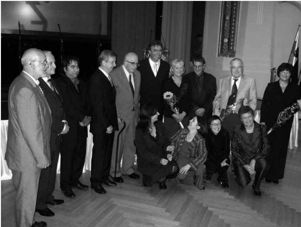
Franc Pediček skupaj z ministrom za šolstvo in šport RS Milanom Zverom in ostalimi nagrajenci ob podelitvi priznanja za življenjsko delo na področju vzgoje in izobraževanja leta 2007.