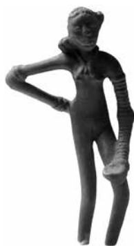
T.i. »plesalka«, bronasti kipec iz Mohenjodare, Pakistan, druga polovica III. tisočletja pr. Kr. (Delhi, Indija, Državni muzej).

Podobe boginje, kot so kipci golih, steatitičnih Vener iz raznih koncev Evrope in Azije, ne izgubijo svojih značilnosti dolga tisočletja. Od kamene dobe naprej (kultura Karanovo VI.-V. tisočletje), ostajajo obline ženskega telesa enako pretirane in spolni atributi enako bujni. Kot smo že omenili, je imela ritualna spolnost v teh matriarhalnih kultih preminentno važnost.