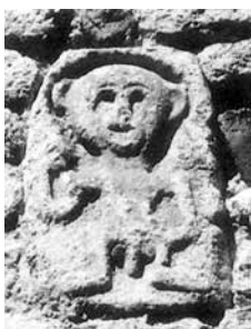
Apotropaični lik iz Lunigiane (Italija)

V Italiji, v občini Filattiera v Lunigiani, je pa vgrajen v zid cerkve sv. Štefana (XI.-XII. stol.) kamniti relief (verjetno zgodnje srednjeveški), ki upodablja moški lik s poudarjenim spolovilom. Sheelah nas tudi spominja na reliefno delo iz bronzaste pločevine (540-530 pr. Kr.) iz kraja Castel San Mariano (prov. Perugia, It.), kjer vidimo GORGONO v podobni drži in celo z jezikom, ki ji molì iz ust (München, Staatliche Antikensammlungen, Nemčija).