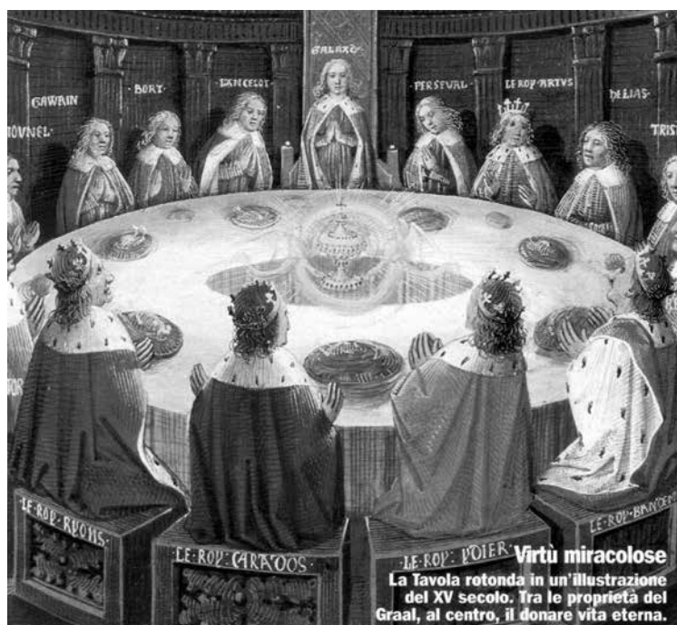
Vitezi okrogle mize, ilustracija iz XV. stoletja