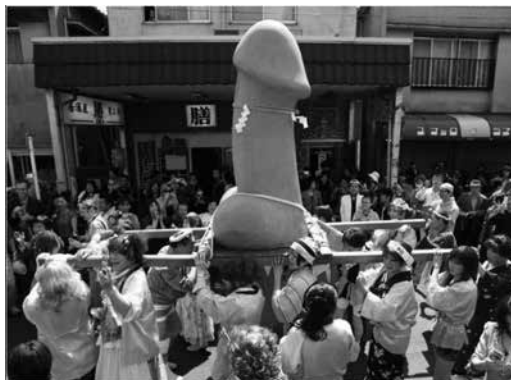
Praznovanje »matsuri« na Japonskem (Komaki)

Potrebno je nekaj povedati o važnem liku ZDRAVNIKA (šamana), ki se od pamtiveka pojavlja v raznih obredjih, čeprav v nekaterih nima več nobene vloge. Že v Vedah je omenjen (Rig-Veda, 10-97, prev. Schroeder) šaman, ki opeva moč svojih ZDRAVILNIH RASTLIN.