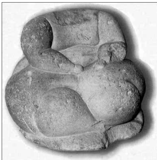
Velika Mati iz Malte (4000-3000 pr. Kr.)

Izhodišče te napredne, matriarhalno urejene kulture, naj bi bili kraji ob južnem obvodju reke Donave (kultura Vinča, VII. tisočl. pr. Kr.; »Scientific American«, maj 1968), kjer naj bi izumili in uporabili protopisavo že pred 7500 leti. Ta kultura se je postopoma širila po širokih donavskih dolinah in dosegla osrčje srednje Evrope. Skiti (Skoloti, Čudi; v stari slov. »skitati se« pomeni potepati se) naj