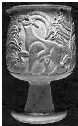
Kupa iz klorita z lepim kozorogom in zeliščem (III. tisočletje. pr. Kr., Jiroft, Iran)

KUPO je z lahkoto nosila MLADENKA v rokah nad glavo, SULICO pa je v procesiji nosil MLADENIČ (oba predmeta sta bila vedno skupaj).