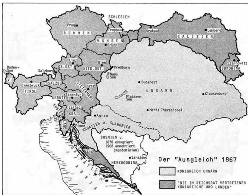
Mogočno Avstro-Ogrsko cesarstvo od leta 1867 do propada

Avstro-ogrski ultimatum kraljevini Srbiji, julija 1914, sta nemški in madžarski narod navdušeno pozdravila in zahtevala krvavi obračun s Srbi, medtem ko pri drugih narodih tega navdušenja ni bilo v taki meri, kakor so si želeli vodilni dejavniki na Dunaju in v Budimpešti.