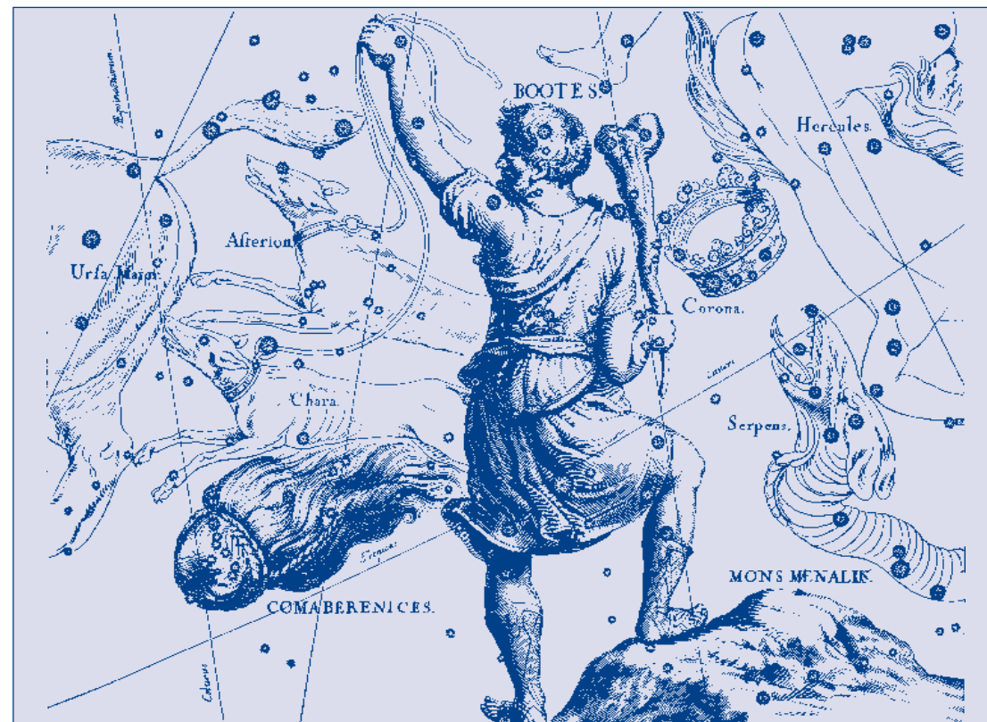
Ozvezdje Berenikini kodri (Coma Berenices) je pri nas vidno zvečer od februarja do avgusta.

Ko so zvečer na kristalno jasnem nebu zablestele zvezde, je iznajdljivi astronom vladarskemu paru pokazal majhen "oblaček" svetlikajočih se zvezd. Rekel jima je: "Te