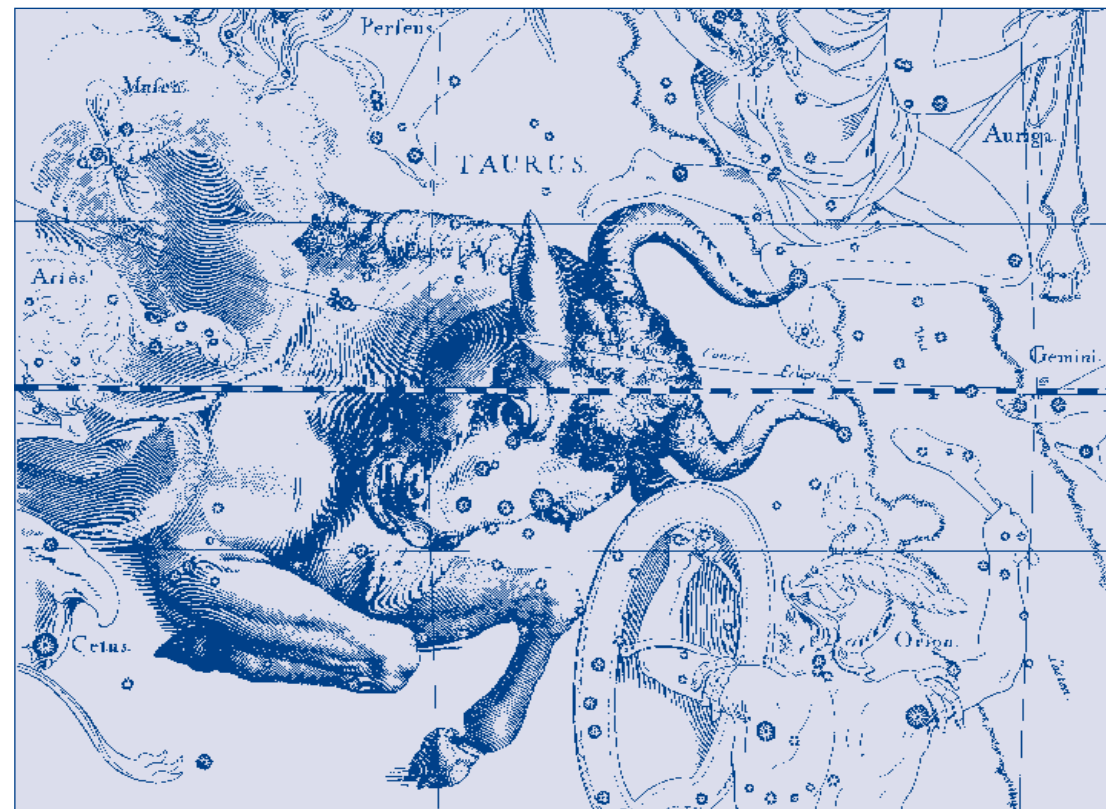
Ozvezdje Bik (Taurus), pri nas zvečer vidno od novembra do marca. Najsvetlejša zvezda je rdečkasti Aldebaran (Oko Bika).

Toda takoj ko se je povzpela na bikov hrbet, je vihravo zdirjal proti morju, se vrgel v valove in z ugrabljenco plaval proti otoku Kreti. Tam se je spremenil v vladarja bogov Zevs in deklico zasnubil. Potem mu je Evropa rodila tri sinove, Minosa (glej Venec), Radamanta in Sarpedona, ki so vsi postali pomembne osebnosti tistega časa.