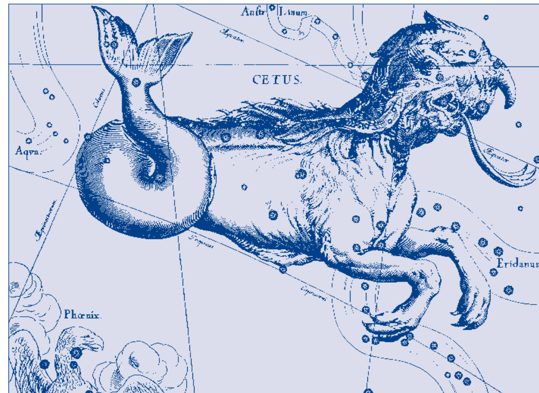
Ozvezdje Kit (Cetus) je pri nas zvečer vidno od oktobra do januarja.

Po poroki sta Andromeda in Perzej najprej odšla na otok Serif, kjer je živela Perzejeva mati Danaja, nato pa so se vsi skupaj odpravili v pokrajino Argo, kjer je Perzej pozneje postal kralj.