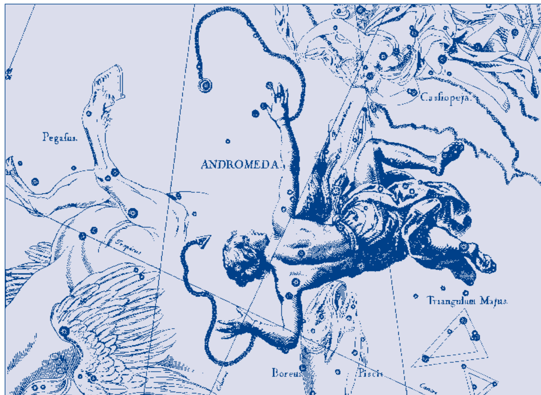
Ozvezdje Andromeda je pri nas vidno zvečer od avgusta do februarja.

po dolgotrajnem boju ji je Perzej z mečem zadal smrtni udarec.