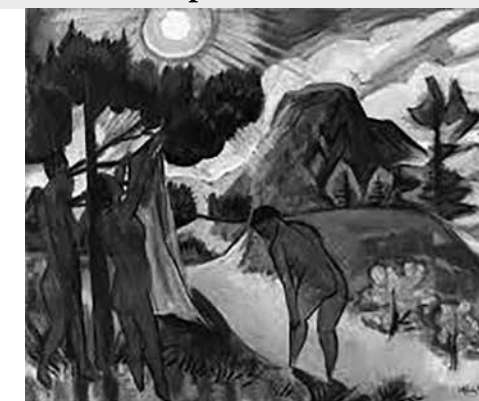
Das Bildnis »Impressionen eines Sonnenaufgangs« des Malers Claude Monet wurde zum Namensgeber der Kunstrichtung »Impressionismus« (links). • Max Pechstein – Sommer in Nidden (rechts).